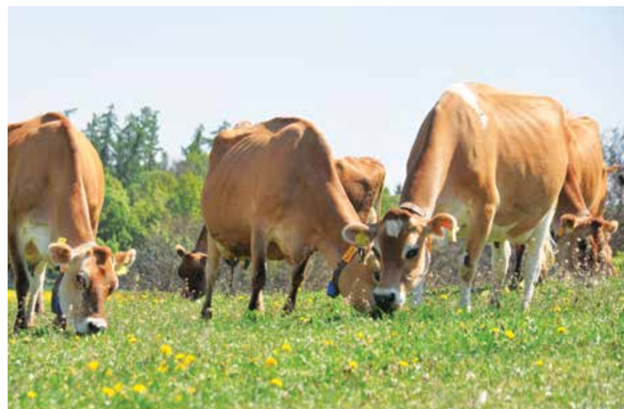
Mléko jerseykého skotu má speciální složení. Je zajímavé, že lidé trpící alergií na kravské mléko mohou pít mléko kozí a jerseyké. Je vhodné také pro vrcholové sportovce, nemocné děti a rekonvalescenty.