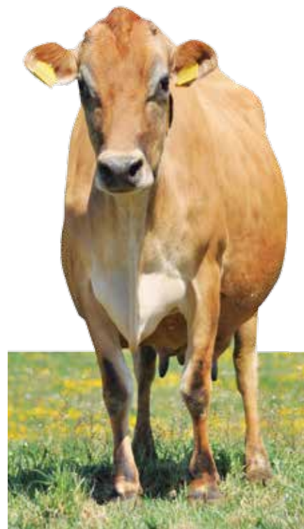
Vzhledem k výsledkům chovu, velkému zájmu o mléko a jeho výbornému zpeněžení vedení ŠZP Lány a ČZU rozhodly, že na farmě Požáry stádo jerseyek ještě rozšíří.

znají. Pokud se ve stádě objeví kráva, která kulhá, tak je to většinou jen proto, že někde venku šlápla na kámen.